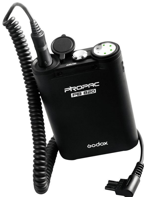
Godox Propac PB 820