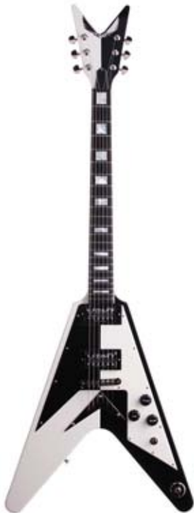
Guitarra Flying Vs