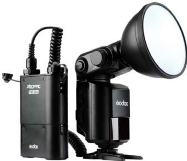
Godox Witstro 360

Como las paredes del rincón no eran paralelas a la fuente de luz, el reflejo se iba fuera del ángulo de toma y esto facilitó la sesión. Al colocar la caja de luz algo lejos, logré que la luz fuese un poco más dura de la que produce una ventana habitualmente.