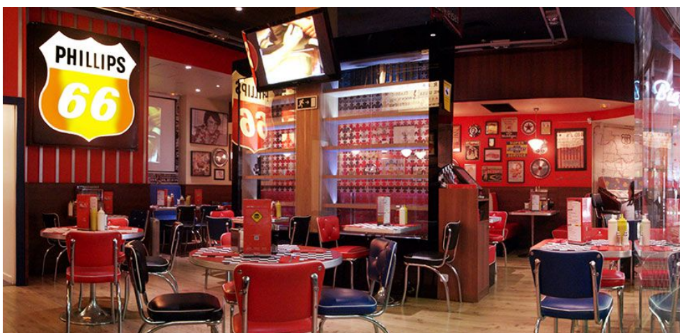
Big J's Burger

Tuvimos la posibilidad de realizar las fotografías en dos ambientes del local y optamos por hacer dos versiones en la misma sesión. La idea fue realizar dos fotos distintas pero complementarias, para luego poder escoger la que transmitiese mejor la idea.