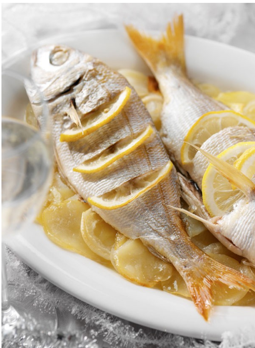
Estilismo Ana Torrónegui

Es un pez de carne delicada, que tradicionalmente se consume en muchos lugares de España en la cena de Nochebuena. Se cocina de variadas maneras y se trata de uno de los pescados azules con menor contenido en grasa, ideal a la hora de preparar menús ligeros.